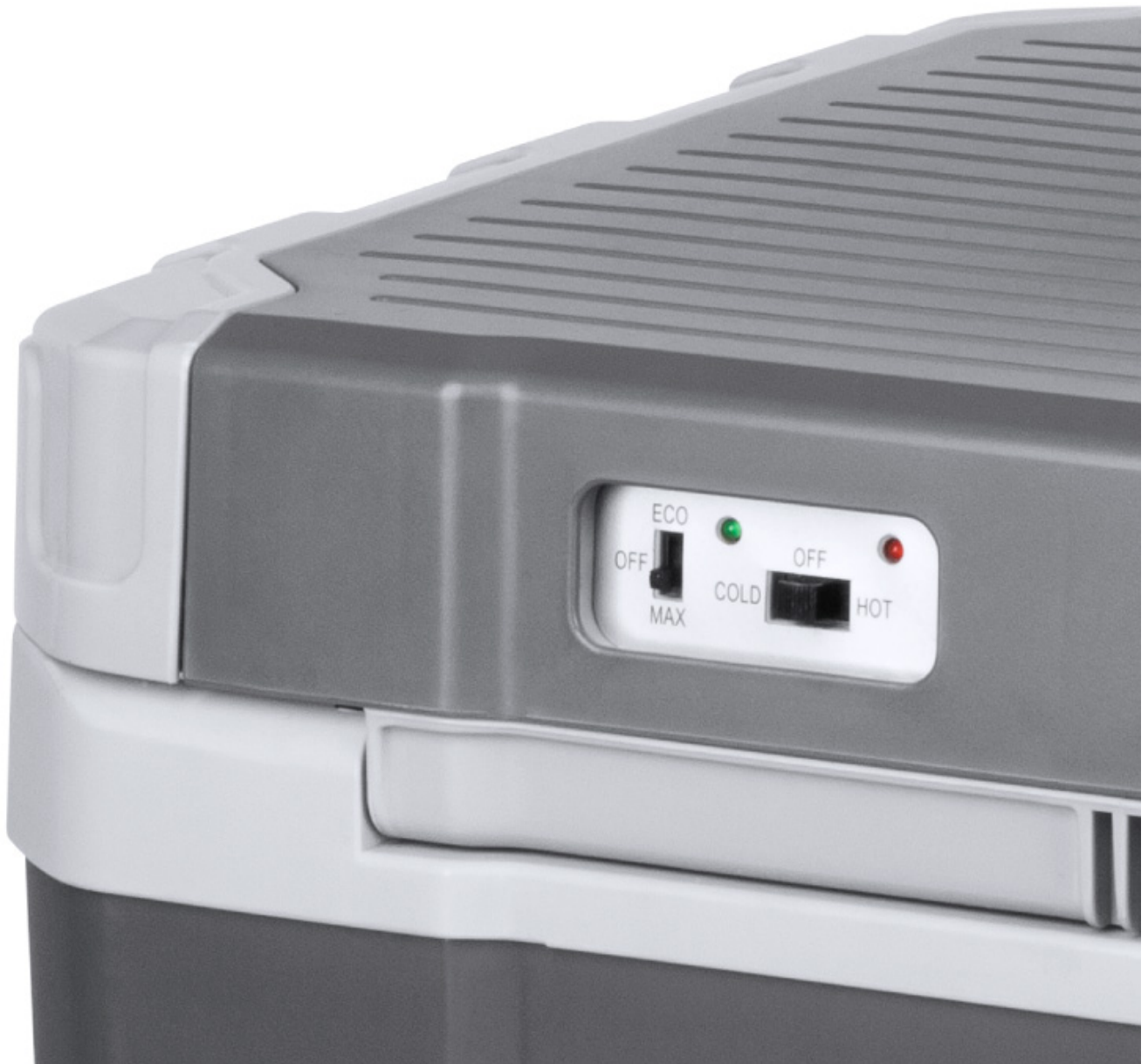
Łatwa zmiana trybu pracy